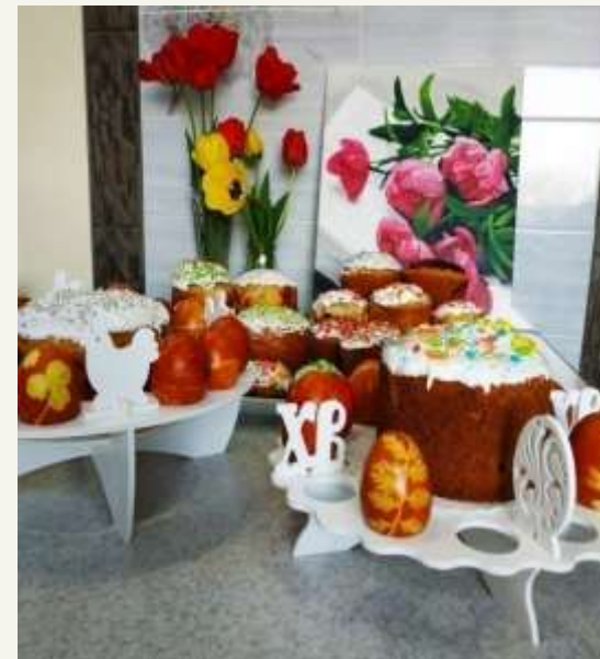
ВЕЛИКОДНІ ПАСКИ ТА КРАШАНКИ