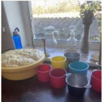
Приготування тіста для пасок