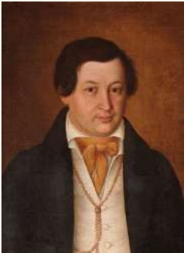
Микола Андрійович Маркевич (1804 — 1860)