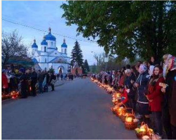
Свято-Михайлівський храм. Світле Христове Воскресіння