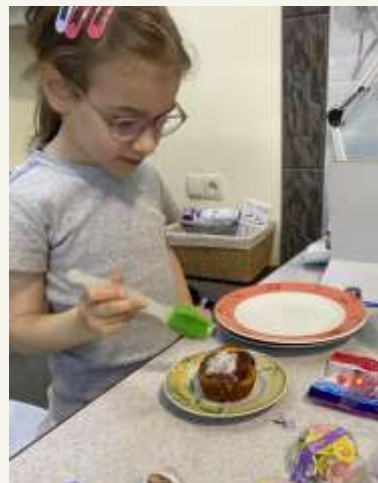
НАСТУПНІСТЬ ПОКОЛІНЬ Родина Тернових. Лисянка