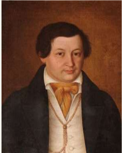
Микола Андрійович Маркевич (1804 — 1860) — український історик, етнограф, фольклорист, поет, композитор