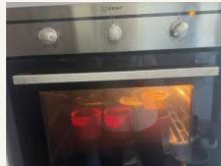
Примітка. Фото надані родиною Тернових