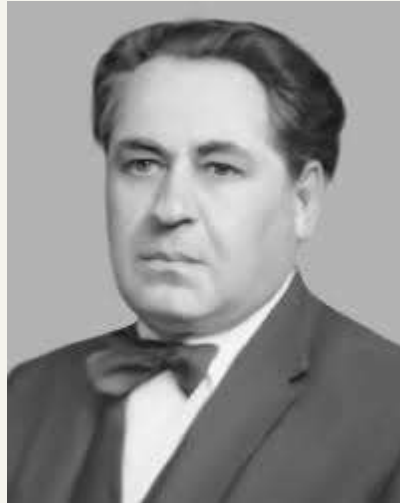
Олєкса Ів́анович Воропай -- (псевдонім Олєкса Степовий) (1913 — 1989) український етнограф, фольклорист, біолог, письменник