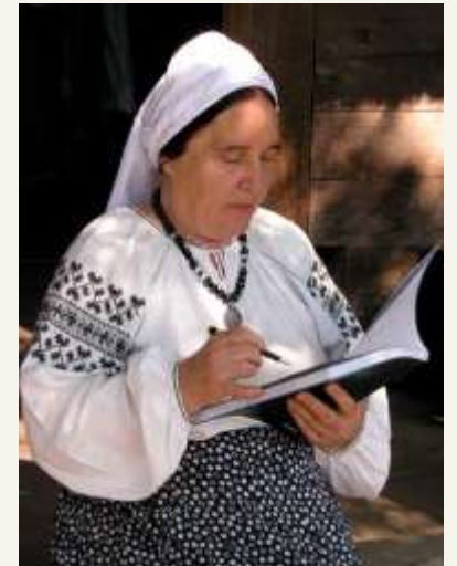
Лідія Григорівна Орел (1937) — український етнограф