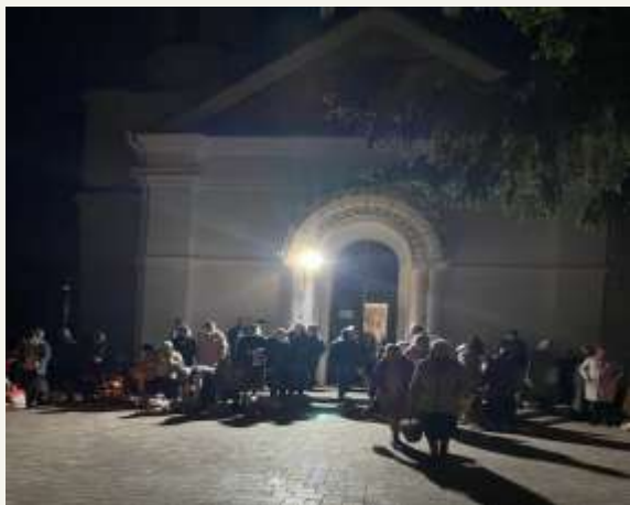
Освячення Пасхальних кошиків на Лисянщині